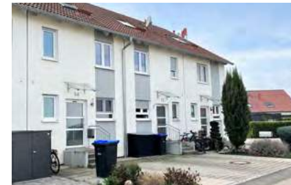
Gepflegtes Reihenmittelhaus mit Garten

Riegel: Wir freuen uns, Ihnen dieses gepflegte Reihenmittelhaus zum Kauf in Riegel anbieten zu können. Das im Jahr 2013 erbaute Haus besticht durch seine solide Massivbauweise und erstreckt sich über drei Etagen.