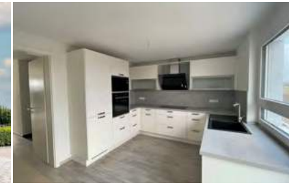
Doppelhaushälfte Nr. 2 mit moderner Einbauküche und Carport

Riegel: Diese Etagenwohnung zum Kauf befindet sich in einer tollen Wohnanlage -die Leopoldshöfe-! Die im Jahr 2019 massiv errichtete Wohnung verteilt sich auf ca. 106 m 2 und bietet Ihnen Platz zum Wohlfühlen.