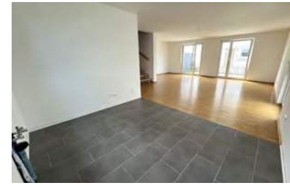
Moderne Neubau Doppelhaushälfte Nr. 2 in Emdingen

Emdingen: Die letzte Gelegenheit das Haus Nr.2 von 4 Häusern zu erwerben. Dieses Jahr wurden in der Dr. Wilhelm-Stumpf-Straße 4 Doppelhaushälften erbaut.