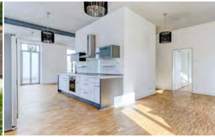
Modernes Loft in historischem Gebäude

Eichstetten: Der einmalige Winzerhof bietet Ihnen historische und moderne Elemente, zeitgemäße Ausstattung, aktuelle Technik und einen parkähnlich angelegten Garten. (Bj. 1597, Gas, 51 kWh)