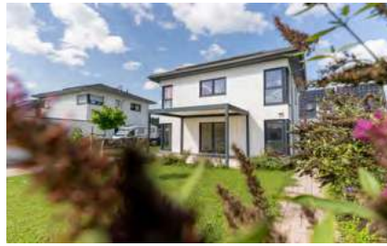
Modernes Einfamilienhaus mit Garten und Garage!

Bahlingen: Dieses attraktive freistehende Fertighaus der Firma Streif mit ca. 151 m 2 Wohnfläche und 502 m 2 Grundstück in Stadtvillaoptik wurde 2019 in Bahlingen erbaut.