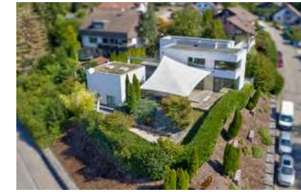
Modernes Einfamilienhaus im Bauhausstil

Steinen: Diese Liegenschaft mit 8 Zimmern besticht durch die moderne Architektur und bietet Ihnen mit dem ca. 1.135 m 2 großen Grundstück ausreichend Komfort und Platz. (Bj. 2006, Gas, 98,4 kWh)