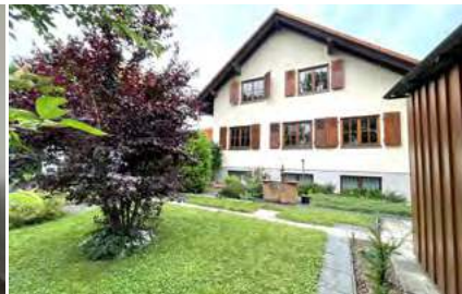
Exklusives Einfamilienhaus mit schöner Gartenanlage

Bahlingen: Diese 4-Zimmer-Maisonette-Wohnung Nr.9 befindet sich in einem Mehrfamilienhaus mit insgesamt 11 Einheiten, welches im Jahr 2000 errichtet wurde.