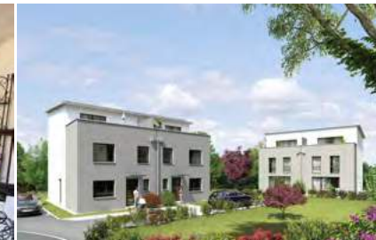
Neue bezugsfertige DHH Nr. 2 in idyllischer Ortsrandlage

Emmendingen: Diese attraktive Wohnung wurde über die Jahre modernisiert und zu einem historischen Schmuckstück hergerichtet. Die zentrale Lage mitten in Emmendingen punktet in allen Lebenslagen.