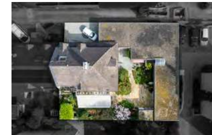
Reduziert — Repräsentative Doppelhaushälfte mit separatem Büroanbau

Preis 1.060.000 EUR Fläche ca. 155 m 2 + 259 m 2