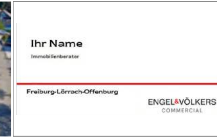
Wir suchen SIE! — Immobilienberater (m/w/d)

Sie schätzen den Umgang mit Menschen, verfügen über Fachwissen im Immobilienbereich und suchen eine neue Herausforderung? Dann freuen wir uns auf Ihre Bewerbung: freiburg@engelvoelkers.com