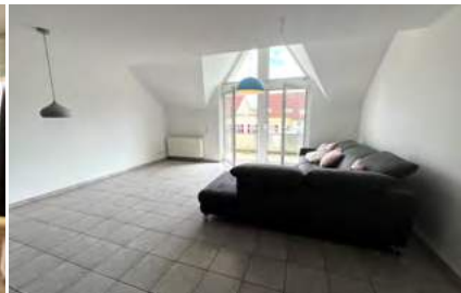
Sonnige 4-Zimmer-Maisonette-Wohnung, bezugsfrei!

Emmendingen: Diese gepflegte 4-Zimmer-Obergeschosswohnung Nr. 20 befindet sich in einem Mehrfamilienhaus in Emmendingen.