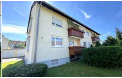
Bezugsfreie Wohnung mit kleinem Balkon!

Emdingen: Das Reihenmittelhaus Nr. 2 verfügt über 5 Zimmer. Das Objekt bietet über ca. 132 m 2 Wohnfläche und ca. 46,61 m 2 Nutzfläche im Keller.