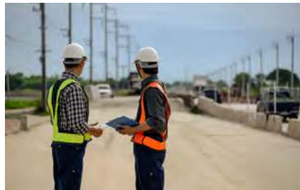
Reduziert — Attraktives Gewerbeobjekt

- Mieter mit 10 Jahresmietvertrag (etabliertes Unternehmen) + 2 x 5J. Option für den Mieter. - Lagerhallen, Büroflächen und Tankanlage auf Freifläche (10.000l). (Bj. 1996, Gas, 238,3 kWh)