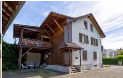
Charmantes Einfamilienhaus mit großer Scheune

- Mieter mit 10 Jahresmietvertrag (etabliertes Unternehmen) + 2 x 5J. Option für den Mieter. - Lagerhallen, Büroflächen und Tankanlage auf Freifläche (10.000l). (Bj. 1996, Gas, 238,3 kWh)