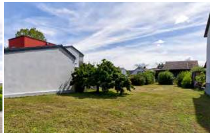
Gut geschnittenes Bauland

Lörrach-Haagen: Dieses EFH mit 9 Zimmern bietet Ihnen viel Wohnraum, verteilt auf 3 Etagen (derzeit in zwei separate Einheiten aufgeteilt), und ein ca. 723 m 2 großes Grundstück. (Bj. 1906, Öl, EA in Erst.)