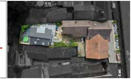
Modernes Einfamilienhaus mit traditionsreichem Restaurant

Offenburg: Das Objekt ist eine Kombination aus erfolgreichem Gastronomiebetrieb und separatem modernem Einfamilienhaus auf einem ca. 893 m 2 großen Grundstück. (Bj. 2012 / 1980, WP / Öl, 66,7 / 145,5 kWh)