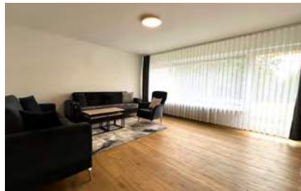
Sehr gut vermietete Kapitalanlage!

Emmendingen: Diese gepflegte 4-Zimmer-Obergeschosswohnung Nr. 20 befindet sich in einem Mehrfamilienhaus in Emmendingen.