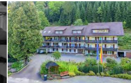
Großzügiges Hotel mit Raum für neue Ideen

Preis 1.125.000 EUR Fläche ca. 195 / 172 m 2