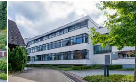
Miete — Attraktive Bürofläche mit flexiblen Möglichkeiten

Oberkirch: Insgesamt stehen Ihnen in diesem modernen Bürokomplex 3 Stockwerke zur Verfügung. Die Gesamtfläche ist ab ca. 225 m 2 aufteilbar. (Bj. 1979, Gas, 108,8 kWh)