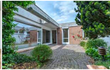
Geräumiger Bungalow mit großem Garten

FR-Herdern: Dieses beeindruckende Loft befindet sich im 2. OG eines historischen Fabrikgebäudes und bietet Ihnen hohe Decken, große Fensterflächen und eine moderne Einbauküche. (Bj. 1892, Gas, 113 kWh)