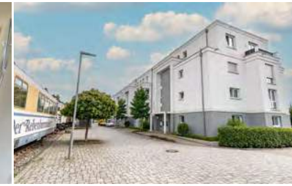
Neuwertige 4-Zimmer-Wohnung mit Balkon in toller Wohnanlage

Emdingen: Die letzte Gelegenheit das Haus Nr.2 von 4 Häusern zu erwerben. Dieses Jahr wurden in der Dr. Wilhelm-Stumpf-Straße 4 Doppelhaushälften erbaut.