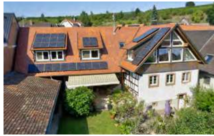
Sanierter Winzerhof mit tollem Garten

Eichstetten: Der einmalige Winzerhof bietet Ihnen historische und moderne Elemente, zeitgemäße Ausstattung, aktuelle Technik und einen parkähnlich angelegten Garten. (Bj. 1597, Gas, 51 kWh)