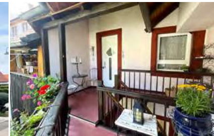
Miete — Großzügiges Wohnen auf 2 Etagen!

Riegel: Wir freuen uns, Ihnen dieses gepflegte Reihenmittelhaus zum Kauf in Riegel anbieten zu können. Das im Jahr 2013 erbaute Haus besticht durch seine solide Massivbauweise und erstreckt sich über drei Etagen.