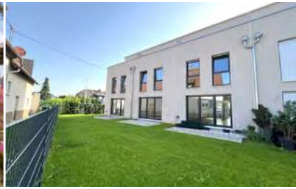
Familienfreundliches Reihenmittelhaus Nr. 2 im Stadtzentrum Emdingen!

Bahlingen: Dieses attraktive freistehende Fertighaus der Firma Streif mit ca. 151 m 2 Wohnfläche und 502 m 2 Grundstück in Stadtvillaoptik wurde 2019 in Bahlingen erbaut.